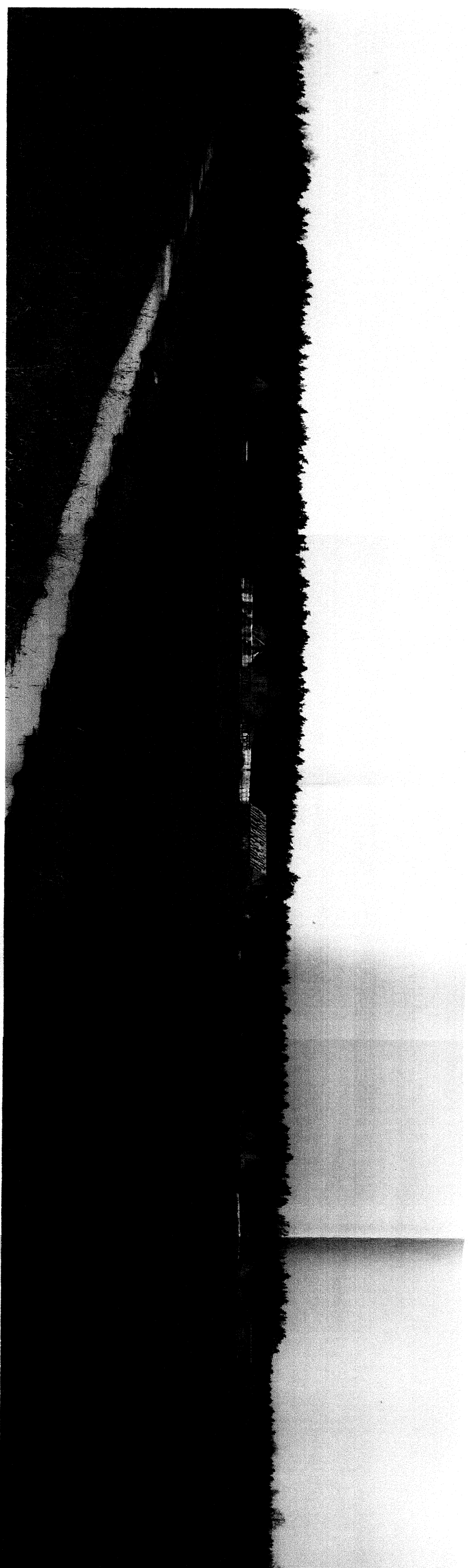
Zdjęcie 3. Obszar objęty projektem planu – użytki zielone oraz zabudowa wzdłuż drogi zwirowej