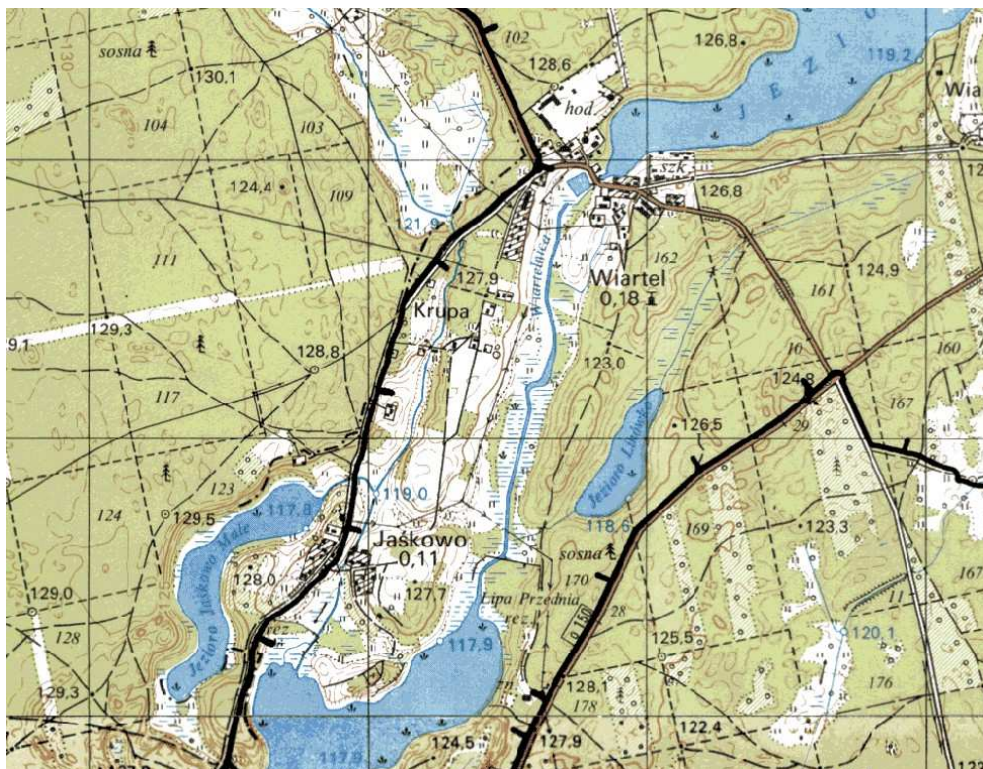
Rys. 2 Granice OChK Puszczy i Jezior Piskich

Obszary Chronionego Krajobrazu tworzone są w celu zapewnienie równowagi ekologicznej. Jest to wydzielone przestrzennie terytorium, obejmujące atrakcyjne krajobrazowo tereny o różnorodnych typach ekosystemów (także zmienionych częściowo przez człowieka), objęte ochroną, pozwalającą zapewnić zachowanie stanu równowagi ekologicznej w środowisku przyrodniczym.