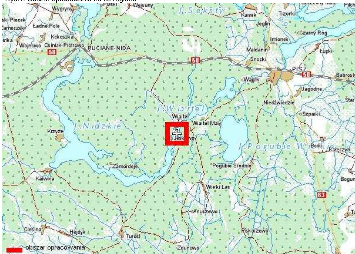
Rys.1. Obszar opracowania na tle regionu

Powierzchnia omawianego terenu zajmuje ok. 66 ha i obejmuje działki o numerach: 24/8, 24/7, 25/6, 24/5, 24/4, 24/2, 24/1, 25, 2122/1, 2122/3, 2122/5, 2122/4, 2122/12, 2122/8, 2122/9, 2122/10, 69, 26, 27, 17/2, 16, 15, 20, 19/1, 19/2, 18/1, 18/2, 2122/11, 14/1, 14/3, 14/4, 14/5, 14/8, 14/7, 12/1, 14/6, 12/2, 12/3, 12/5, 12/4, 12/6, 13, 12/7, 11, 10, 9, 8, 7, 6, 5, 4, 2, 39, 36 – część działki, 47 – część działki, 48/1, 48/2, 48/4, 48/5, 48/6, 37, 38, 34/13, 34/12, 34/11, 49/2, 49/1, 34/37, 34/15, 34/27, 34/4, 34/16, 34/20, 34/28, 34/10, 34/21, 34/17, 34/18, 34/19, 34/22, 34/23, 34/29, 34/30, 34/31, 34/72, 34/71, 34/8, 34/7, 34/24, 34/25, 34/26, 34/32, 34/33, 34/6, 34/5, 34/35, 34/36, 34/34, 34/3, 32/6, 32/7, 32/5, 32/3, 32/2, 29, 28/1, 28/2, 30, 31, 72, 32/8, 45/2, 46/1, 46/2, 46/3, 50, 52/1, 53, 54, 55/1, 55/2, 57/1, 57/3, 57/2, 56/1, 56/2, 58, 59, 61/8, 61/7, 61/6, 61/1, 61/5, 61/4, 61/3, 61/10, 61/11, 60.