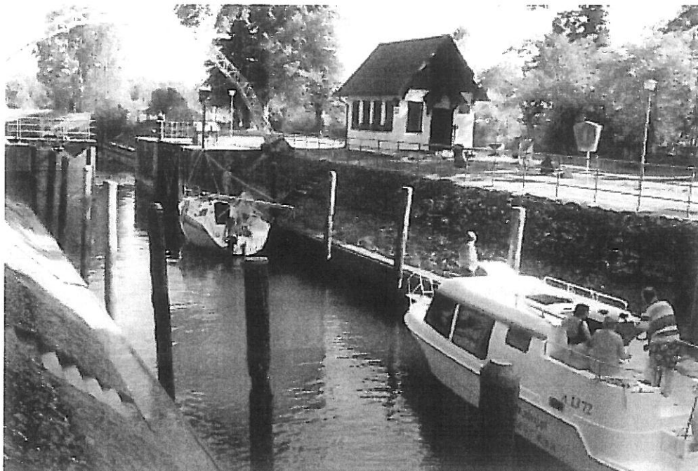
Fotografia 2. Budynek nad śluzą Karwik