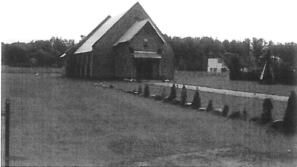
Fotografia nr 4. Cmentarz w Karwiku