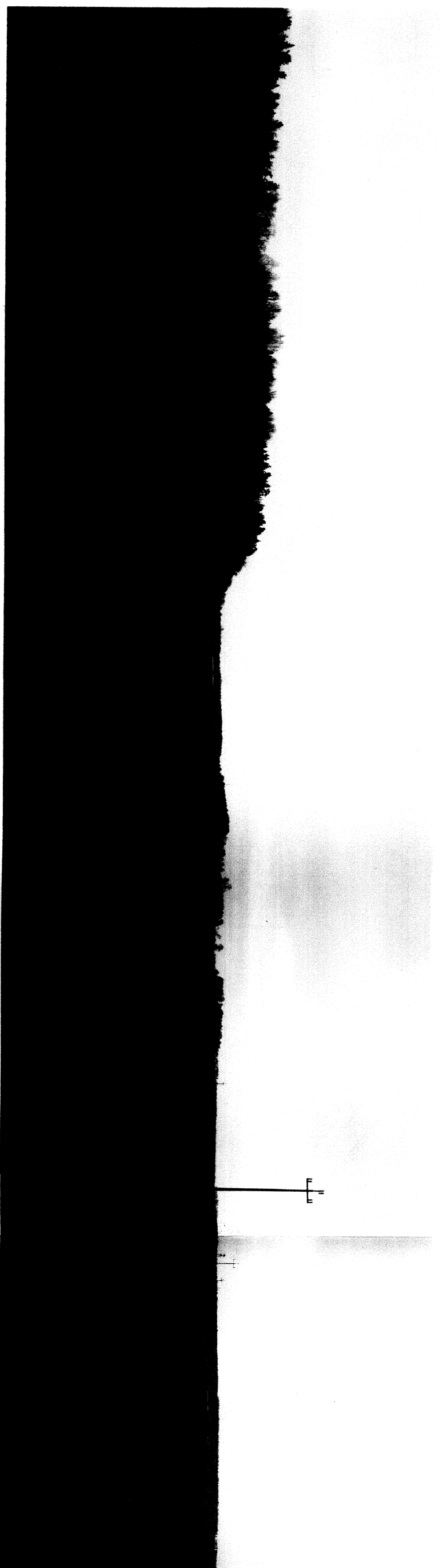
Zdjęcie 5. Pola orne – północna część obszaru objętego projektem planu