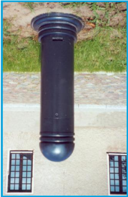
Słupek zaopatrzeniowy ( poboru energii) typu TVP-3000 f-my "TRAPP-GmbH" Sp. z o.o.