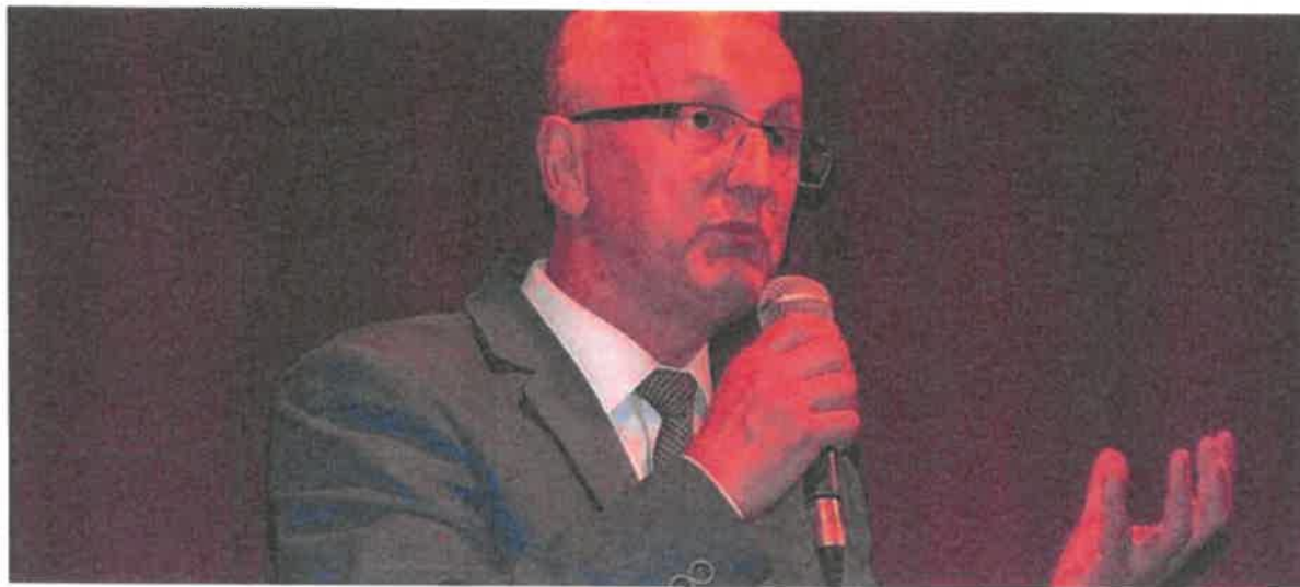
Burmistrz Pisz Andrzej Szymborski

2018-06-19 13:51:17 (ost. akt: 2018-06-19 13:58:16)